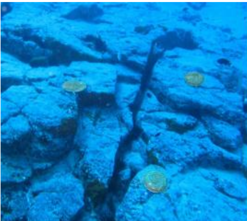
Die ersten drei Bronzeplaketten mit Kosmogrammen in 18,5 m Tiefe